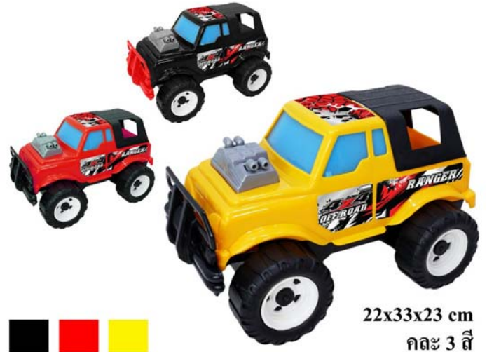
22x33x23 cm กล่อง 3 สี