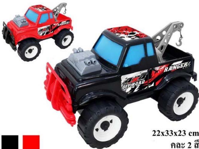
22x33x23 cm กล่อง 2 สี

ชื่อสินค้า รถออฟโรดสายแบก รหัสสินค้า 9757B ขนาดสินค้า 8.5 x 13 x 9 นิ้ว บรรจุ 1 โหล (ถง) ลักษณะพิเศษ